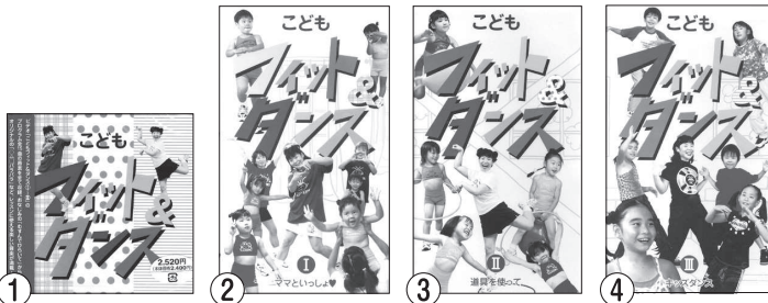
CD・DVD こどもフィット&ダンス