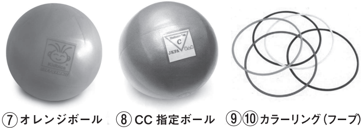
⑦ オレンジボール ⑧ CC指定ボール ⑨⑩ カラーリング(フープ)

※日本こどもフィットネス協会会員・SI会員様は会員価格、SI価格でご購入頂けます。