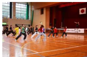
一般公開レッスン