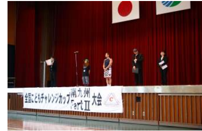
審査員・リードの皆様