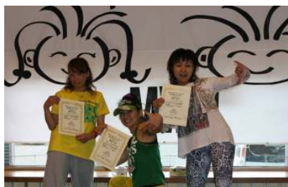
チャレンジサーキット 一般部門エアロビクス 左から2位、1位、3位