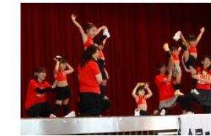
お楽しみ演技発表