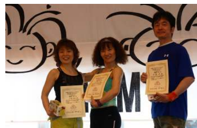
チャレンジサーキット 一般部門ヒップホップ 左から2位、1位、3位