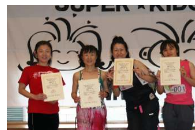
チャレンジサーキット 一般部門ヒップホップ 左から4位、5位、6位、7位