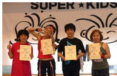
チャレンジサーキット 一般部門エアロビクス 左から4位、5位、6位、7位