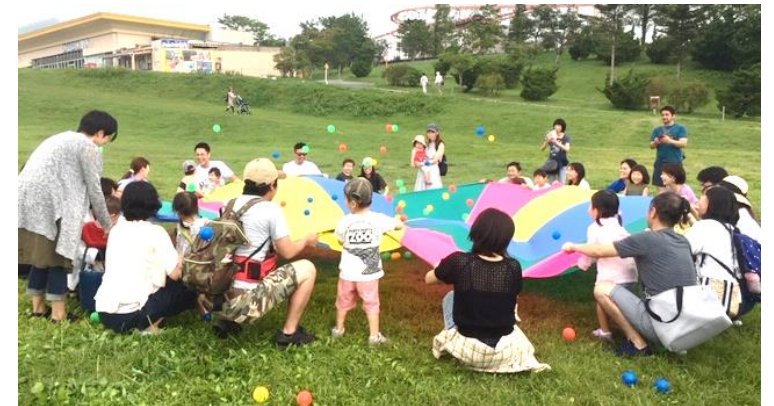
アクティビティの一例

今回のワークショップでは、 屋外で楽しめるキッドビクスのプログラムをご用意します。 リズムに合わせて体を動かしたり、 みんなで一緒に大きなバルーンテントで風を感じたり、 小さなお子さんから楽しめるアクティビティとなっています。 ぜひ親子で参加して、たくさんのキュンを感じてください。