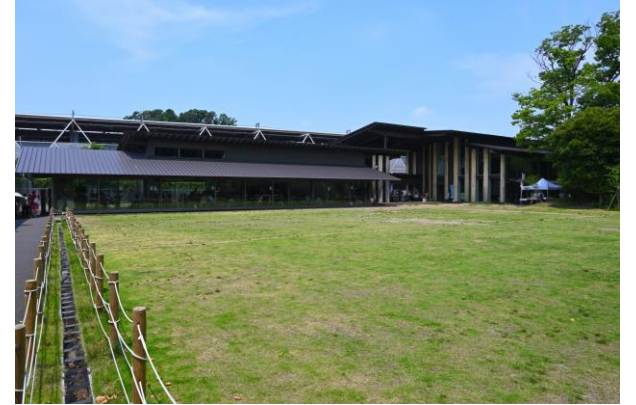
会場の多目的広場

多摩川に近い大田区田園調布に広がるのどかな公園です。 開催場所の多目的広場は、 日頃から親子がくつろぐ憩いの場となっています。