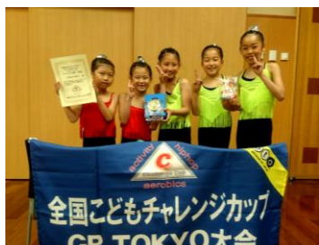
GP TOKYO 大会