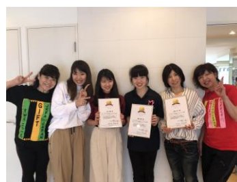
修了式&修了パーティー