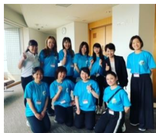
GP TOKYO 大会スタッフ