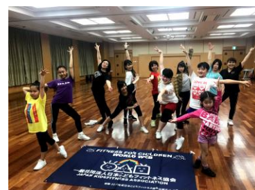
スポーツエアロビク